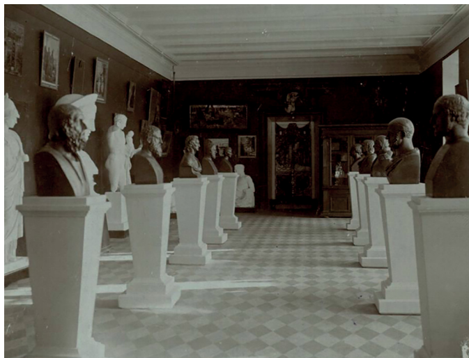
Музей изящных искусств и древностей Императорского Казанского университета. 1890-е гг. Национальный музей Республики Татарстан, отдел изобразительных и документальных источников, инв. № В-11752/2.

Museum of Fine Arts and Antiquities of the Imperial Kazan University. 1890s. National Museum of the Republic of Tatarstan, Department of Fine and Documentary Sources, no. 11752/2.