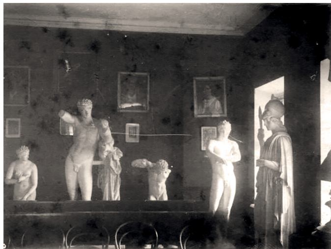
Музей изящных искусств и древностей Императорского Казанского университета. 1890-е гг. Национальный музей Республики Татарстан, отдел изобразительных и документальных источников, инв. № В-11752/1.

1) Египетская коллекция, насчитывавшая к 1886 г. 165 экспонатов. Благодаря описи профессора Б. А. Тураева, специально приезжавшего в Казань для изучения египетского собрания, становится ясной ее история и состав. Коллекция входила в состав кабинета редкостей при музее Фирсова и сформирована в два этапа: в 1842 г. в кабинет от неизвестного сдатчика поступили мелкая пластика, скарабеи и небольшая мумия, в 1868 г. – казанский путешественник Прутченко пожертвовал несколько предметов, в том числе чехол мумии и крышку саркофага. Анализ описи Тураева позволяет судить о преимущественно декоративно-прикладном характере египетского собрания: коллекция была представлена мелкой пластикой (статуэтки египетских богов, ушебти, амулеты и скарабеи). Среди этого массива выделяются несколько интересных