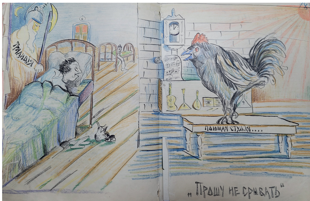
Рисунок на развороте рукописи. ГА РТ, ф. 51, оп. 8, д. 514, л. 77 об.-78.