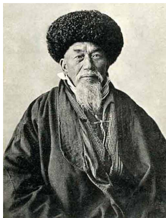
Астраханский татарин.

Astrakhan Tatar.