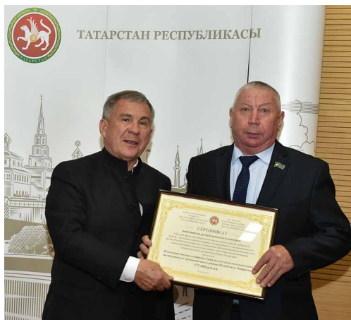
Президент РТ Р. Н. Минниханов вручает Главе Смаильского сельского поселения Балтасинского муниципального района Республики Татарстан Р. Г. Юсупову сертификат на 375 тыс. рублей. Казань, 2022 г.

Административ үзәк – Смәел авылы. Смәел дигәч үк тал чыбыгыннан үргән бишек-урындыклар, бизәкле сандыклар, матур итеп эшләнгән йортлар күз алдына килә. Әйе, халкы тырыш, эшчән. Һөнәрчелек бабайлардан балаларга оныкларга күчкән. Бүгенге көндә дә тал чыбыгыннан эшләнгән урындыклар, бишекләр, гөл чүлмәкләре, кисеп ясалган тәрәзә йөзлекләре, төзеклеге, матурлыгы белән