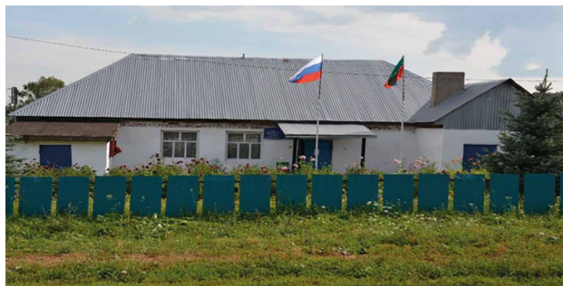
Здание Исполнительного комитета Кулегашского сельского поселения.

Кулегашское сельское поселение богато своей историей и для лучшего сохранения истории нашего поселения хочется благоустроить архив нашей организации.