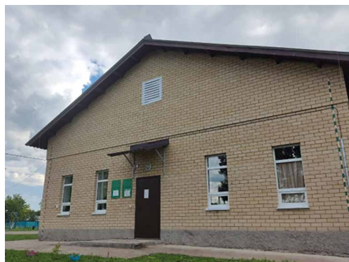
Здание Исполнительного комитета Акбашского сельского поселения.

Җирлек документларын саклап калып, без киләчәк буынга аларның ата-бабалары, әти-әниләре, аларның яшәү рәвешләре, нәрсәләр белән шөгыльләнүләре турында мәгълүматны саклап калдырабыз. Бу безнең алда торган иң төп бурычларның берсе.