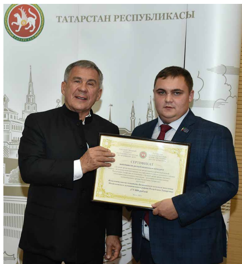
Президент РТ Р. Н. Минниханов вручает Главе Бизиякинского сельского поселения Менделеевского муниципального района Республики Татарстан И. И. Кашафутдинову сертификат на 375 тыс. рублей. Казань, 2022 г.

Цели проекта: сохранность архивных документов в цифровом формате; обеспечение доступности архивных документов широкому кругу населения; предупреждение угроз утраты бумажного носителя, сведений в них.