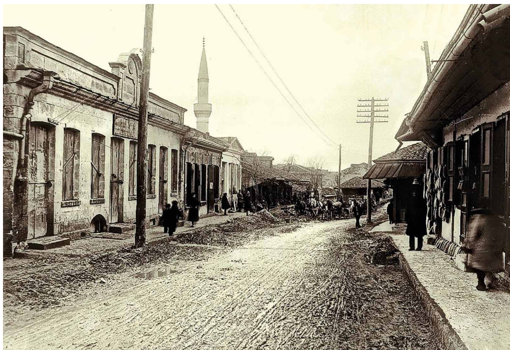
Центральная улица Бахчисарая в квартале Арслан-ага. 1920-1930 гг. Из фондов Бахчисарайского историко-культурного и археологического музея-заповедника.

The central street of Bakhchisarai in the Arslan-aga quarter. 1920-1930ss. From the funds of Bakhchisaray Historical, Cultural and Archaeological Museum-Reserve.