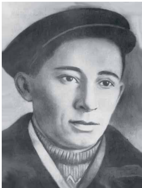
А. Симаев. Электронный ресурс. Режим доступа: idel-tat.ru

А. Simaev. [On-line]. Available at: idel-tat.ru