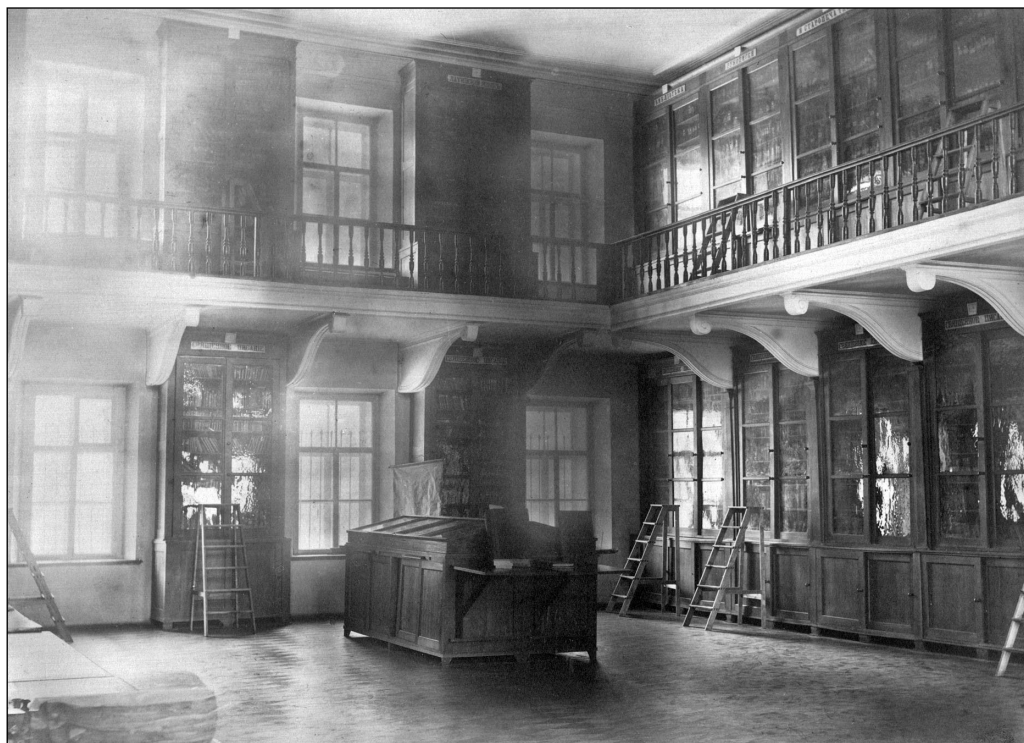
Интерьер библиотеки Казанской духовной академии.

ние классики, разнородные учебники. Среди книг были сочинения Эразма Роттердамского, Лютера, толкования Священного писания, русские издания Новикова, Щербатова, Карамзина. К концу 1844 г. библиотеку академии, насчитывающую около 900 названий в 1 800 томах, можно было считать более или менее сформированной.